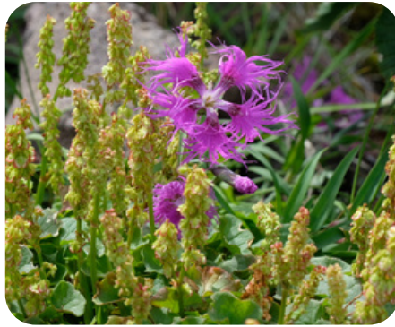
エゾカワラナデシコ