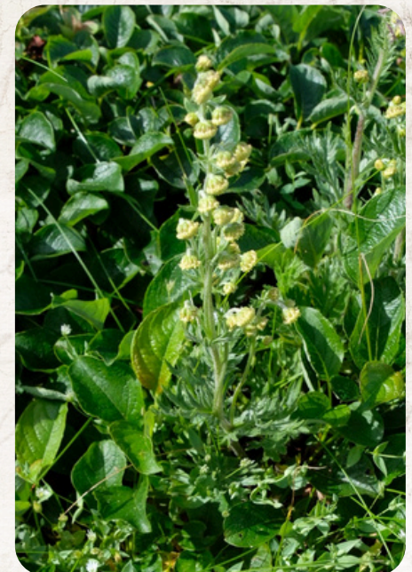
エゾムカシヨモギ