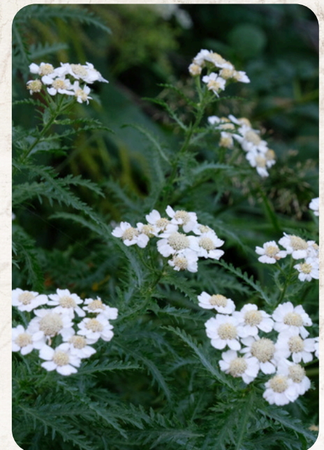
エゾノコギリソウ