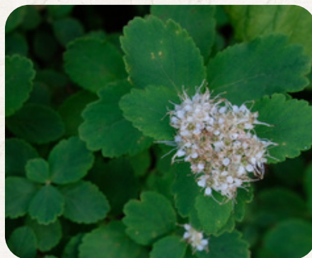
エゾノマルバシモウケ