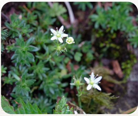
ホソバシコタンツウ