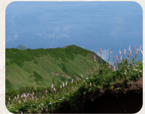
イブキトラノオの行進