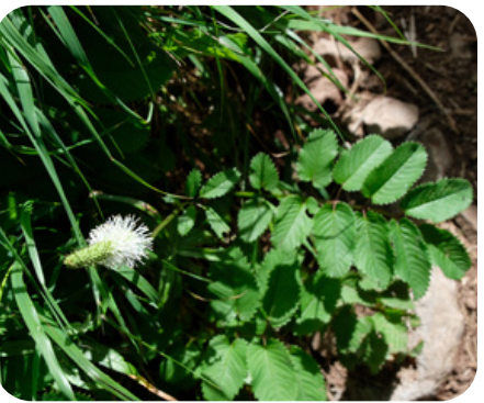
タカネトウモロコシ