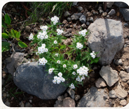
エゾノコギリツウ