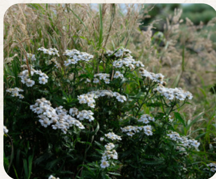
エゾノコギリソウ