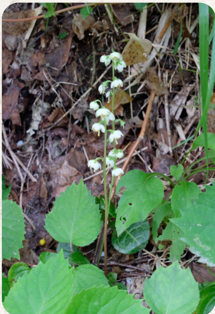
カラフトイラクソウ