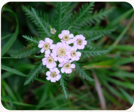
キタノコギリソウ